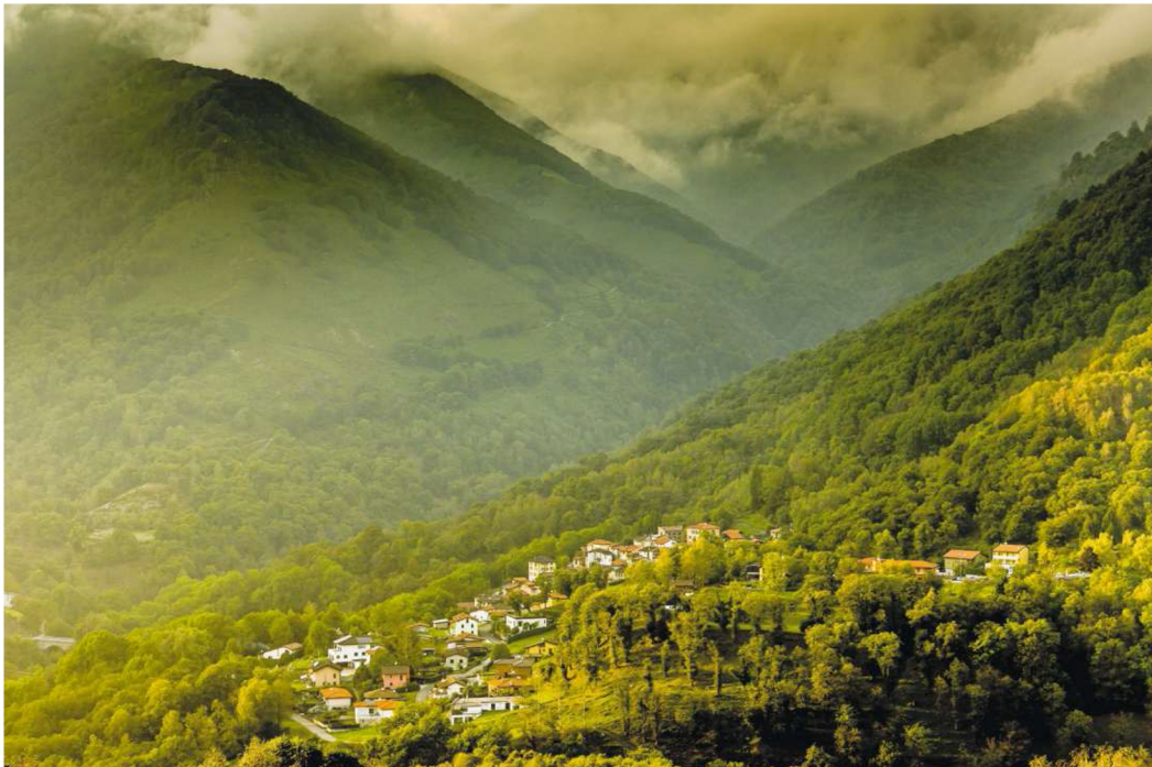
Gekocht, gebraten, getrocknet und gemahlen – die Kastanien gehören zur Tessiner Küche. Um zu gedeihen, brauchen die Bäume stetige Pflege.